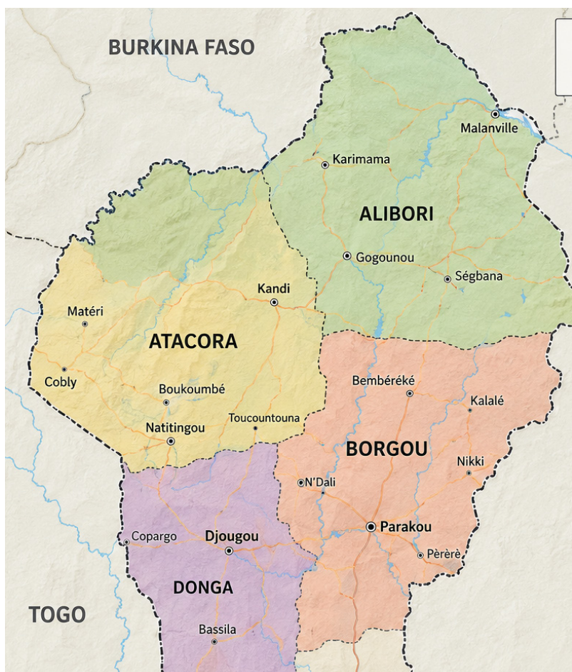
Carte du Nord du Bénin

Il s'agit d'un projet de recherche-action qui vise à promouvoir la participation inclusive des communautés locales, notamment des minorités socio-ethniques, à la co-construction des politiques publiques locales dans les régions frontalières du nord du Bénin, confrontées à des crises sécuritaires liées à l'extrémisme violent.